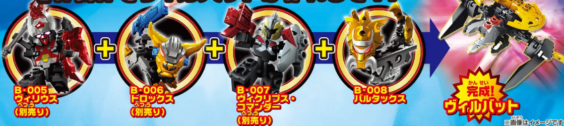
B-005 ウィリウス (別売り)